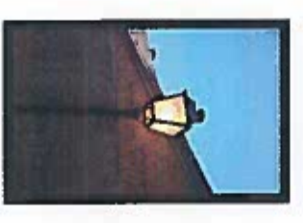
FAROL TIPO VILLA EN BACULO